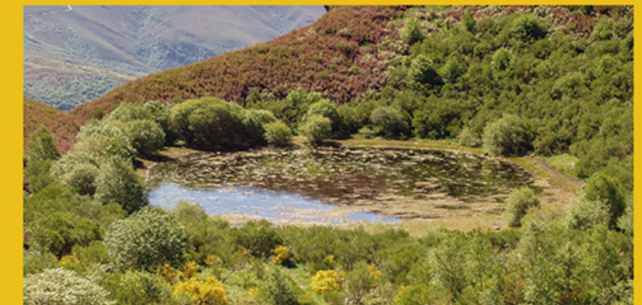
25 Laguna de la Lucenza A Lucenza Lake