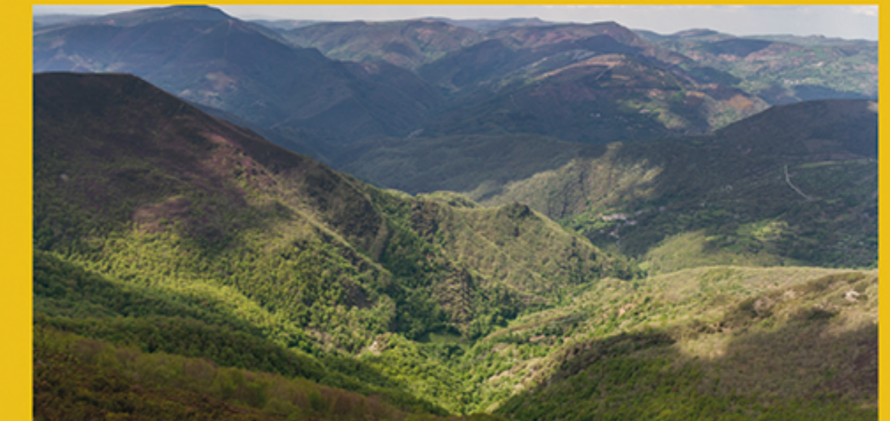
13 Devesa da Rogueira Devesa da Rogueira Native Forest

A Geopark is an area with a unique geological heritage, which has an independent sustainable development strategy. It has clearly defined boundaries, which are in line with municipal boundaries, and sufficient surface area (578 km 2 , in this case) to generate its own economic development. At a Geopark, the processes that form the landscape are interpreted and understood, particularly sites of significant geological interest, geosites, and other sites of ecological, archaeological, ethnographic, historic, industrial and cultural importance in general. As a whole, a Geopark represents a new way of enjoying the natural environment and a significant opportunity for economic activity, based on the promotion of geotourism. On top of this, Geoparks provide the opportunity to educate children in geological values, enabling them to enjoy geological heritage thanks to the geoconservation initiatives developed.